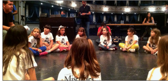
II MÁLAGA CLÁSICA EN EL CONSERVATORIO AUDICIONES PARA EPONINE. LOS MISERABLES