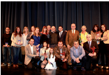
IX PREMIOS MÁLAGA VOLUNTARIA