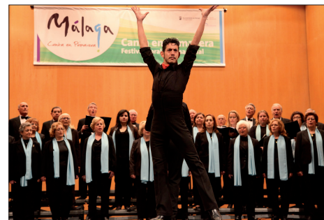
FESTIVAL CORAL INTERNACIONAL "MÁLAGA CANTA EN PRIMAVERA"