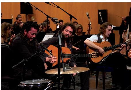
CONCIERTO DE SAN VALENTÍN