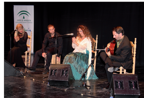
MÁLAGA CANTAORA 2013