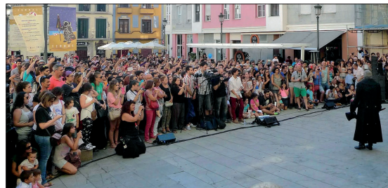
TODO SOBRE VÁZQUEZ. MUSEO DE HUELLAS LOS MISERABLES . PASACALLES