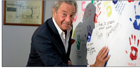
CLASE TÉCNICA DEL BALLET NACIONAL DE CUBA ARTURO FERNÁNDEZ. MUSEO DE HUELLAS