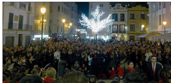
CICLO DE DANZA. EXPOSICIÓN ENCENDIDO DE LAS LUCES DE NAVIDAD